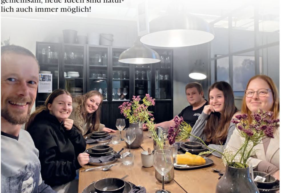
Das Bild zeigt einen Teil der Bockhorner Jugendgruppe beim Ikea-Ausflug.